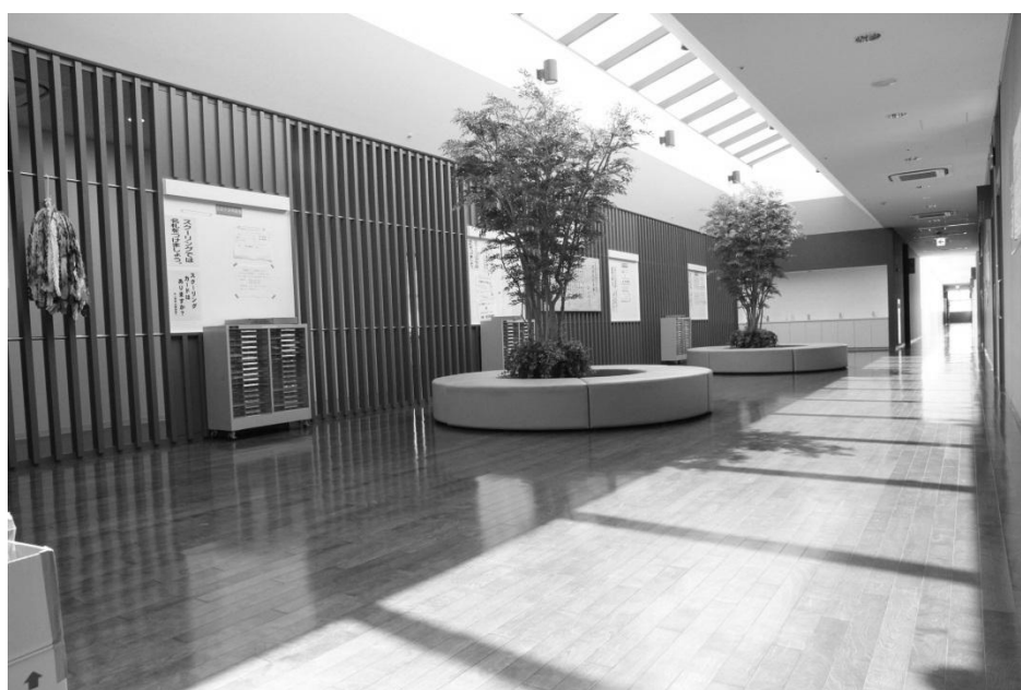
校舎内掲示板のある明るいラウンジ

宮城県美田園高等学校 〒981-1217 名取市美田園二丁目1番地の4 「まなウェルみやぎ」4F TEL 022-784-3572