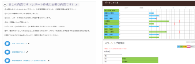
Meラーニング（アクセス数学）

また、レポート作成をサポートするために、本校生徒専用ウェブサイト「Myスタ」を設け、レポート作成のヒントや注意点、スクーリングで配付したプリント等が掲載されたeラーニングのサイト「Meラーニング」と、レポートが第何回まで合格しているか、スクーリングに何回出席したかが確認できるeポートフォリオのサイト「Meポートフォリオ」があります。