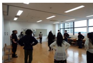
リラックスコミュニケーション講座