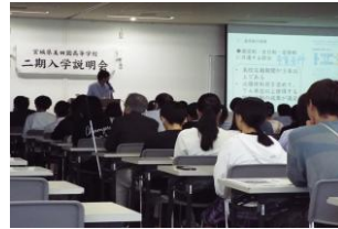
二期入学説明会（8月）

中学校を卒業してから年月が経っていても、4月の入学と変わらない高校生活をスタートすることができます。